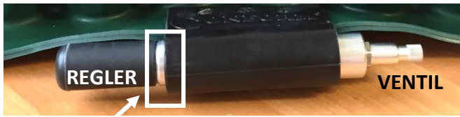
Ansicht: GESCHLOSSENER Regler

Den Regler sowie das Ventil durch Drehbewegung öffnen .